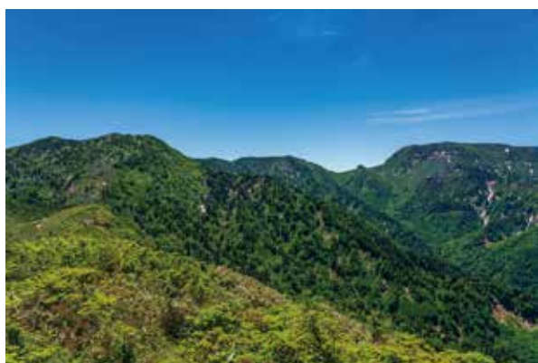
～刈払いコース 霧ノ塔付近 苗場山頂を望む～