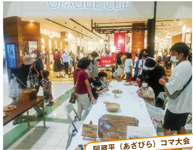
阿蔵平（あざびら）コマ大会