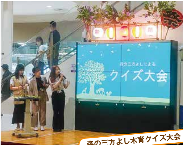
森の三方よし木育クイズ大会