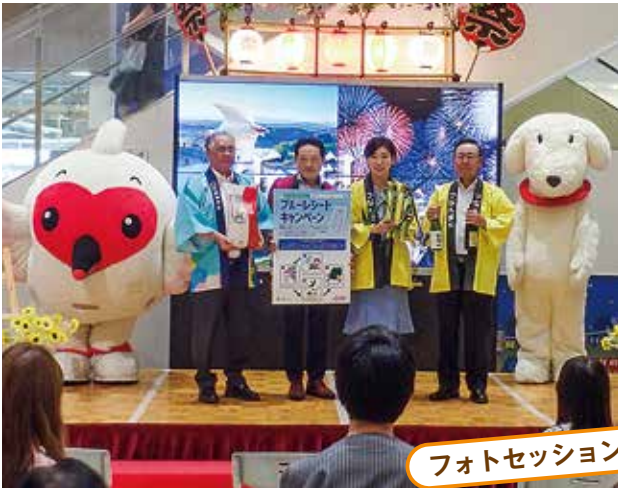
フォトセッション