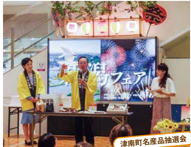
津南町名産品抽選会