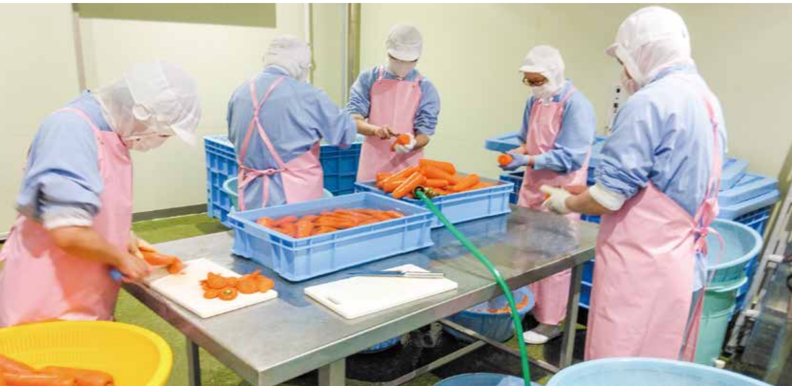
雪下にんじん皮むき作業

〒949-8311 新潟県中魚沼郡津南町中深見乙2176 発行/津南町森林組合 TEL.025-765-2510