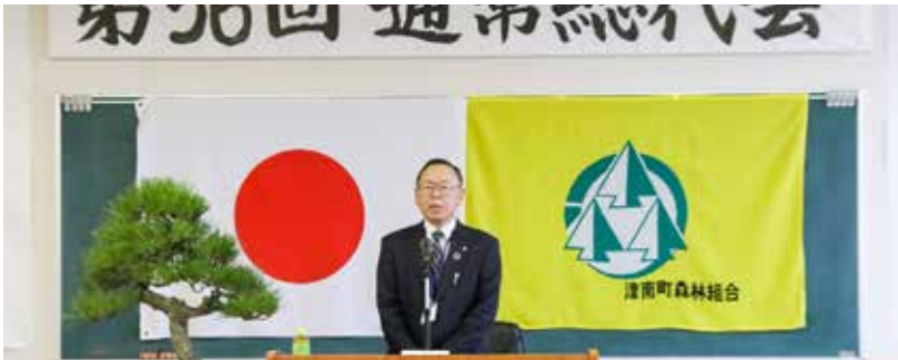
涌井代表理事組合長開会あいさつ

今期も大変厳しい状況が予想されますが、組合員皆様並びに関係機関よりご指導いただく中で、役職員一丸となり努力して参りますので、宜しくお願い申し上げます。