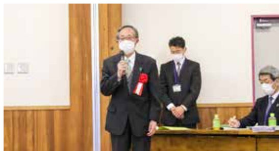
芦ヶ崎生産森林組合 本山組合長様受賞挨拶