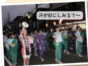
汗が目にしみるて～