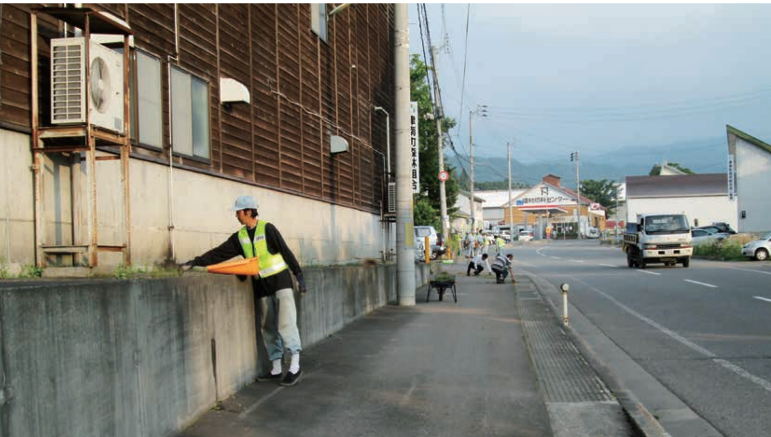
第6回クリーン活動

〒949-8311 新潟県中魚沼郡津南町中深見乙 2176 発行/津南町森林組合 TEL.025-765-2510