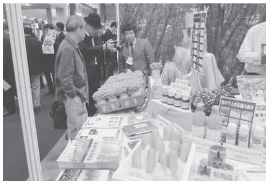
津南町森林組合ブース風景

域の農林産物を使った加工食品のPR、新規取引先の開拓を目的とし、職員一同1年前より新商品の開発や準備を進めてまいりました。