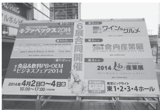
東京ビッグサイト

フェアベックスは、惣菜デリカ・弁当・中食・外食業界の業務用専門の国内最大の展示会で、3日間で74,581名というたくさんの方の参加の目的は、地元津南町や地